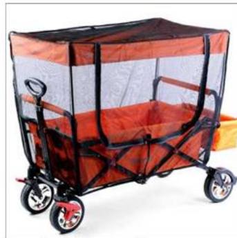
Protection solaire et anti-insectes (disponible pour tous les modèles CT500)