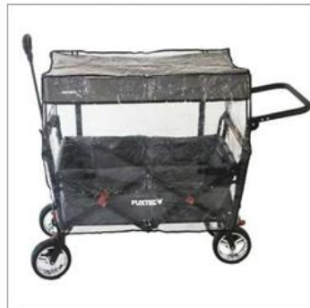
Protection imperméable transparente (disponible pour tous les modèles du CT500 au CT700)