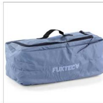
Glacière en plusieurs coloris (disponible pour tous les modèles)