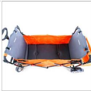
Matelas de chariot pour enfant court et long (disponible pour tous les modèles CT500 à CT700)