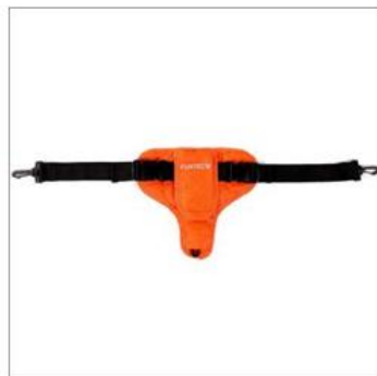
Ceinture de sécurité en plusieurs coloris (disponible pour tous les modèles)